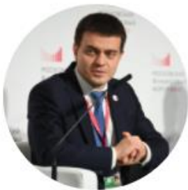
Котюков Михаил Заместитель министра финансов России